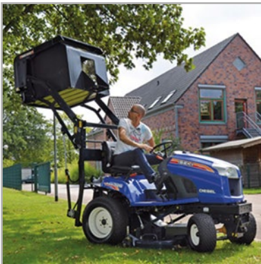
Abb. beispielhaft - Abhängig von Verfügbarkeit und Aktualität