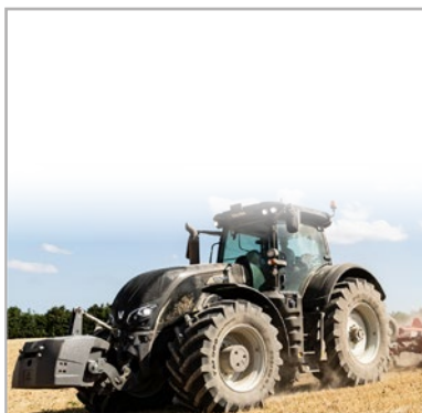
Abb. beispielhaft - Abhängig von Verfügbarkeit und Aktualität