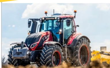
Abb. beispielhaft - Abhängig von Verfügbarkeit und Aktualität