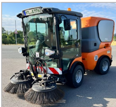
Abb. beispielhaft - Abhängig von Verfügbarkeit und Aktualität