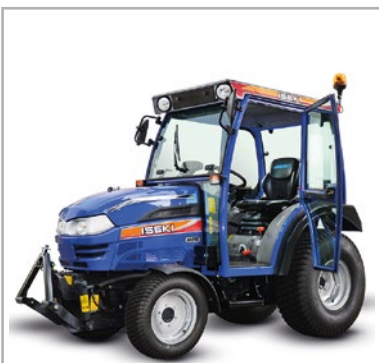
Abb. beispielhaft - Abhängig von Verfügbarkeit und Aktualität

Saisonmiete / Langfristmiete auf Anfrage